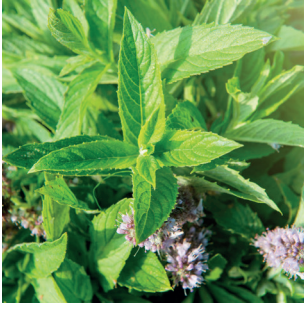
Mentha sp. Minze Menthes