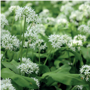
Allium ursinum Bärlauch Ail des ours