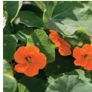
Tropaeolum sp. Kapuzinerkresse Capucine