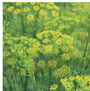
Foeniculum vulgare Fenchel Fenouil