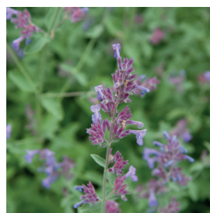
Melissa officinalis Zitronen Melisse Méisse officinale