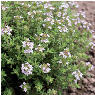
Thymus vulgaris Thymian Thym commun