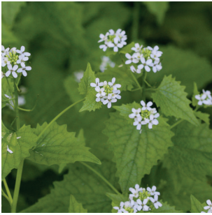
Alliaria Petiolata Knoblauchrauke Herbe à ail

Unsere Partnergeschäfte bieten Ihnen mindestens 3 der folgenden Kräuter in Bio-Qualität.