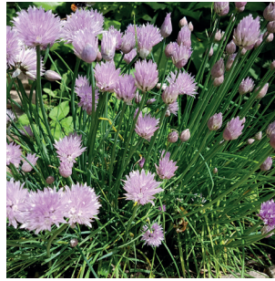
Allium schoenoprasum Schnittlauch Ciboulette