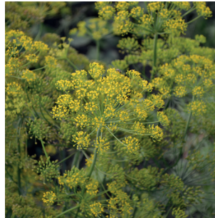
Anethum graveolens Dill Aneth