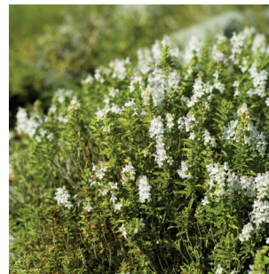
Satureja sp. Bohnenkraut Sariettes