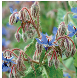
Borago officinalis Borretsch Bourrach