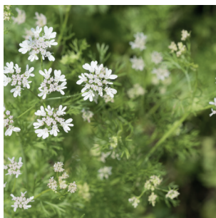
Coriandrum sativum Koriander Coriandre