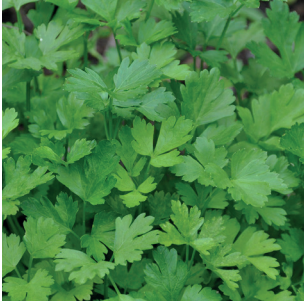
Petroselinum sativum Glatte Petersilie Persil plat