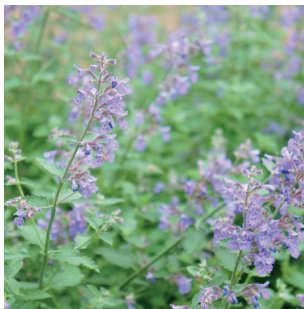
Salvia officinalis Echter Salbei Sauge officinale