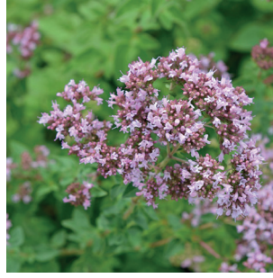
Origanum sp. Oregano /Majoran Origon / marjolaine