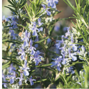
Rosmarinus officinal Rosmarin Romarin