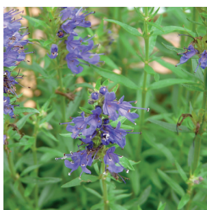
Hyssopus officinalis Ysop/Bienenkraut Hysope